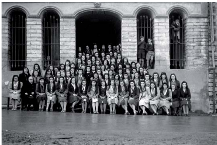
Gogo jardunaldien bukaeran taldearen erretratua Osintxun. 1946ko urtarrilean.