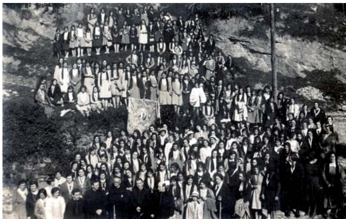
Arantzazura "Mariaren Alabak" kongregazioaren peregrinazioa. 1945-1950 urte artean.

Bibliaren pasarte honetan garbi ikusten da elizaren pentsamoldea: "Emazteak izan daitezela beren senarren menpeko, Jaunaren menpeko bezala, senarra emaztearen buru baita, Kristo Elizaren buru den bezala..." .