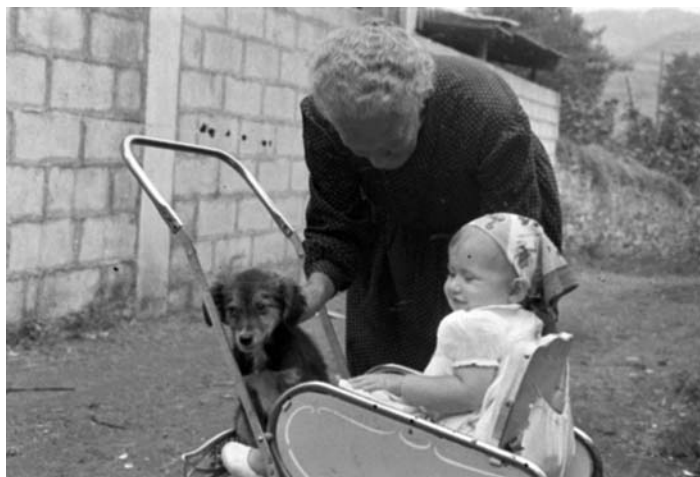
Emakume bat umearekin. 1958.