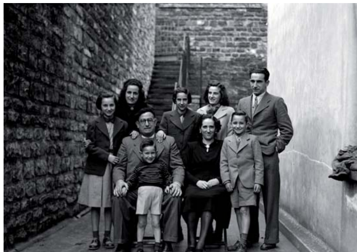
Manso familia. 1940ko hamarkadan.

Emakumeak legeen aurrean ere ez zuen autonomiarik: ezkondu aurretik aitaren menpe zegoen eta ezkondu ostean, berriz, senarraren menpe.