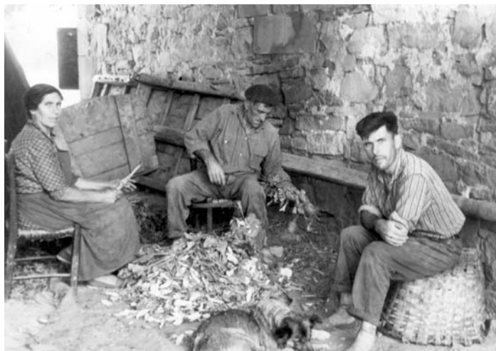
Emakumea eta bi gizon lanean. 1964.

Halere, soldatapeko lana, gizonak egiten zutena, jotzen zen benetako lantzat, eta etxeke lanei ez zitzairen inolako baliorik ematen.