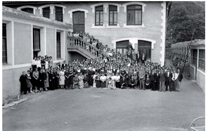
Algodonerako langileak. 1940ko hamarkadan.