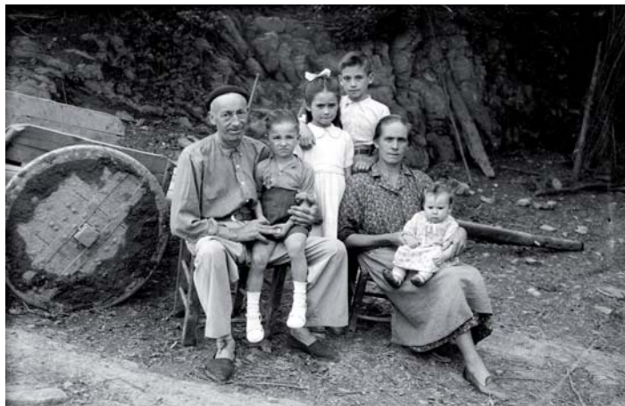
Familia erretratua gurdiaren aurrean.