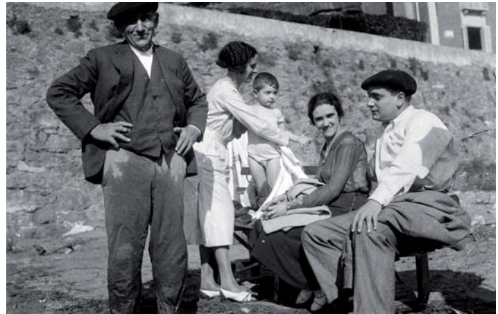
Jauregi familia Debako hondartzan. 1930eko hamarkadan.

Dena den, emakumearentzat antolatzen ziren ekintza gehienak erlijioarekin zuten lotura. Elizak Mariaren Alaben kongregazioa eta beste batzuk sortu zituen nesKentzat eta, benetako helburua kristau onak egitea bazen ere, aktibitate batzuk antolatzen zituzten han zebiltzanak gustura egon zitezen, eta emakume askorentzat bilgune bilakatu ziren.