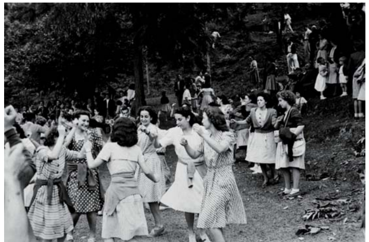
Emakumeak dantzari San Martzialen. 1947 urtean.